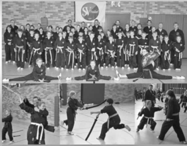
13. Mai 2023